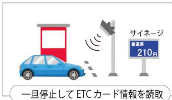
E T C 読取イメージ

■本件に関するお問い合わせ先 ※別紙3「社会実験における実施体制」をご参照ください。