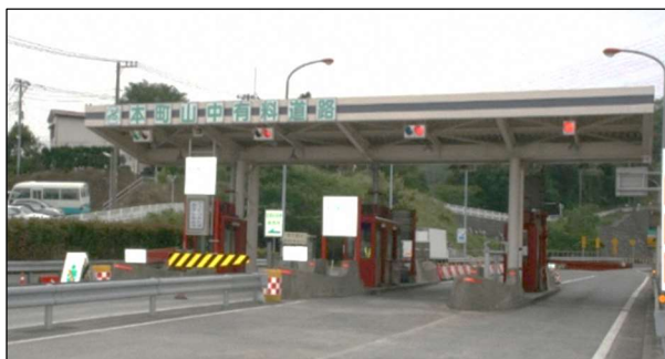
本町山中有料道路